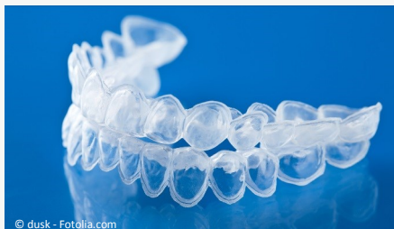
Bleaching-Form aus Kunststoff, in die Sie das Aufhellungs-Gel einfüllen.

Beim Home-Bleaching werden vom Zahnarzt dünne flexible Formen aus einem transparenten Kunststoff hergestellt, die genau auf Ihre Zähne passen (siehe Foto).