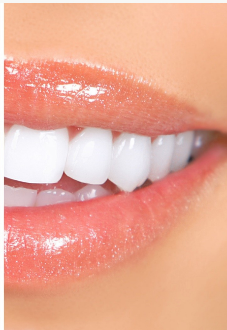
Deutlicher Unterschied: Professionelles Bleaching beim Zahnarzt wirkt!