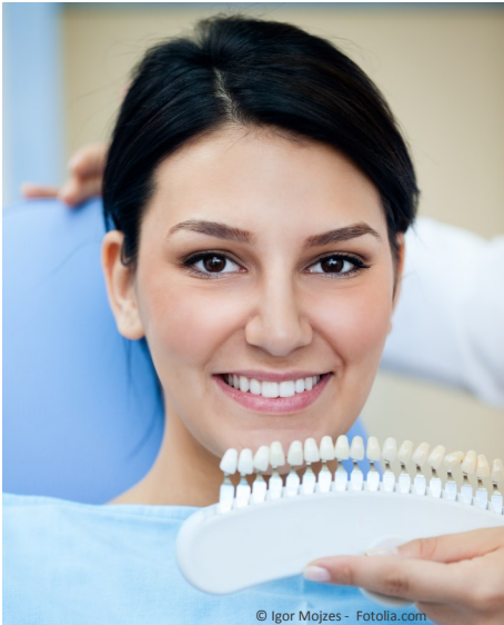
Bleaching vom Zahnarzt: Gewinnendes Lächeln mit strahlend weißen Zähnen

Professionelle Zahnaufhellung durch den Zahnarzt